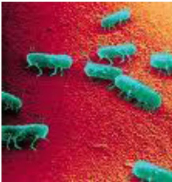
Figure 2: Salmonella Typhimurium

La lavorabilità del laminato in alluminio e le resistenze chimico – fisiche del prodotto pre-verniciato vengono così nobilitate dalle proprietà igienico – sanitarie di questa finitura superficiale.